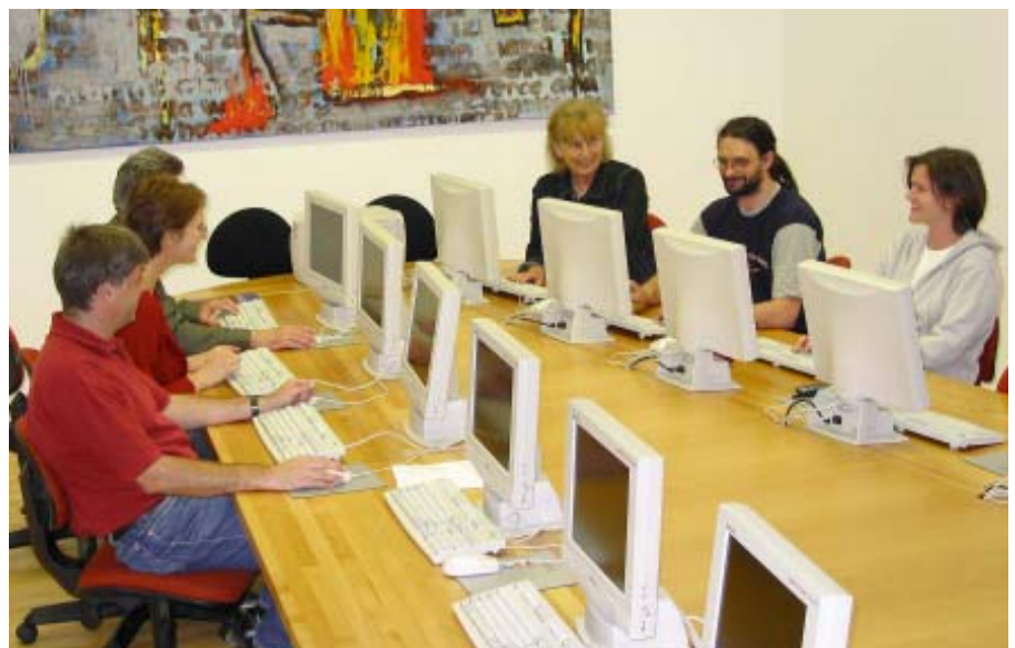
Viele Plätze bleiben heute ungenutzt: IT-Training in der Weiterbildung